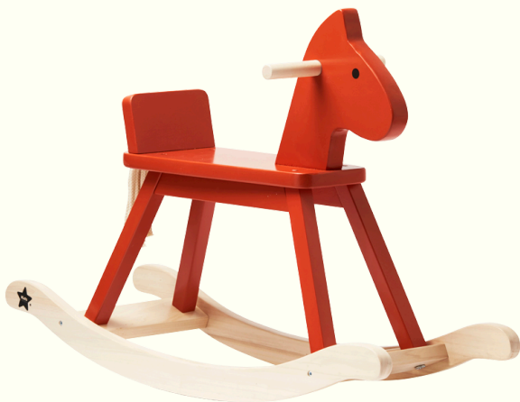
Cheval à bascule

Une partie de l'intrigue se déroule dans la chambre d'enfance de Nayéla.